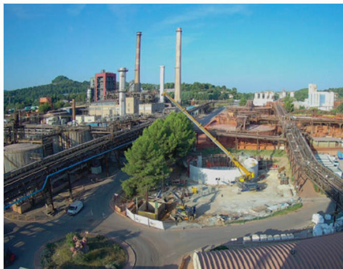
Nouvelle station de traitement de l'eau par injection de CO 2

Prévue pour être opérationnelle dès 2019, la construction de la nouvelle station de traitement de l'eau par injection de CO 2 avance à grand pas. Située au cœur de l'usine à Gardanne, elle mobilise aujourd'hui une dizaine d'entreprises partenaires, comme Gagneraud, Engie, CTR, CIM, Mouteau Nicolle, etc.