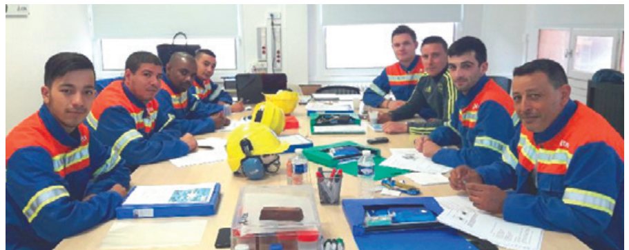
La formation de nos équipes aux métiers de fabrication aval, au conditionnement et à la logistique

Ce processus de formation interne à nos métiers a été mis en place pour répondre à une double problématique : transmettre les connaissances de génération en génération d'une part, et former plus efficacement les nouveaux arrivants d'autre part.